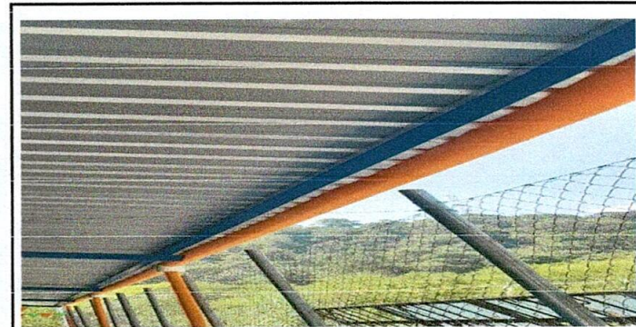
Bajada de agua pluvial

Observación: Si es necesario se pueden agregar hojas adicionales y actualizar el número de hojas.