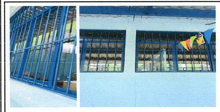
Sustitución de estructura de metal de ventana