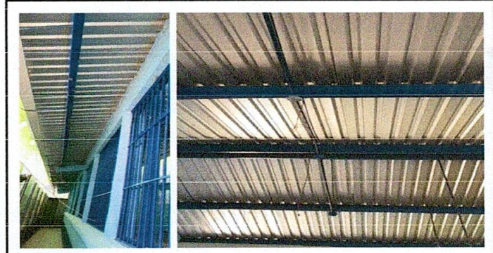
Mantenimiento a estructura de soporte de metal