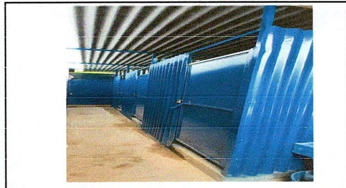
Mantenimiento de puertas de servicios sanitarios