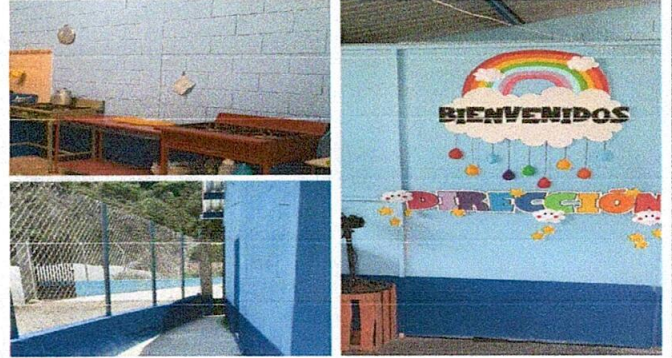
Pintura en muros exteriores e interiores