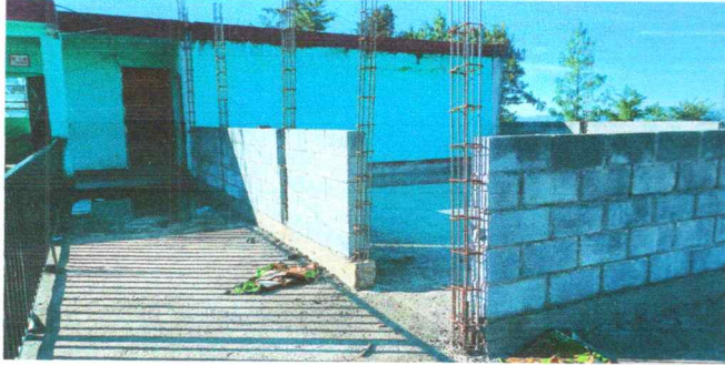
Foto1: ESTRUCTURA DE TECHO