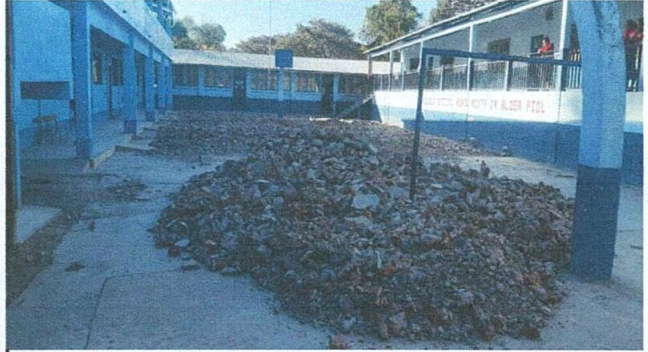
Foto2: Levantamiento del piso para la ejecución del remozamiento y proceso de la cancha polideportiva