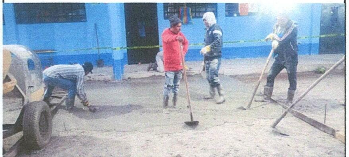
Foto 4: preparación del lugar para la fundición de la nueva cancha.