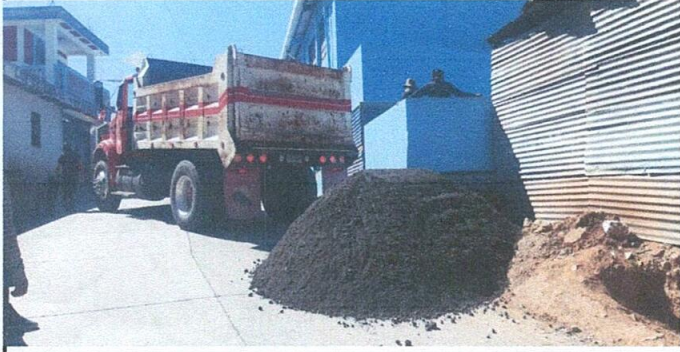
Foto 1: Inicio de la obra de pavimentación de la cancha polideportiva, recibiendo los primeros materiales.