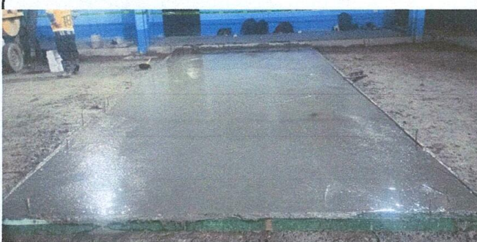
Foto 5: Fundición del primer cuadro de la obra de la cancha polideportiva en construcción