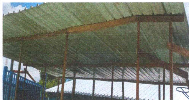
Foto 4: Sustrucción de estructura de soporte de madera, por metal