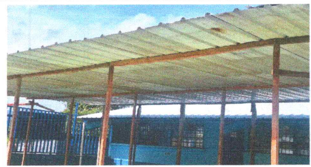
Foto 3: Sustrucción de estructura de soporte de madera, por metal