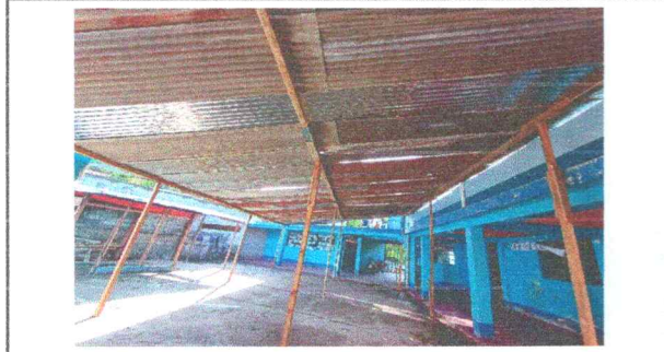
Foto1: sustitución de lámina