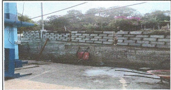
Foto 4: Reparación de muro perimetral de block con soleras intermedias