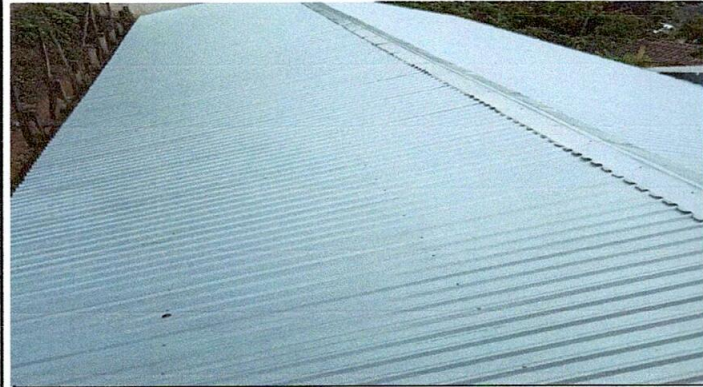
Foto 1: Sustrucción de lámina simple por lámina troquelada aluzinc calibre 26