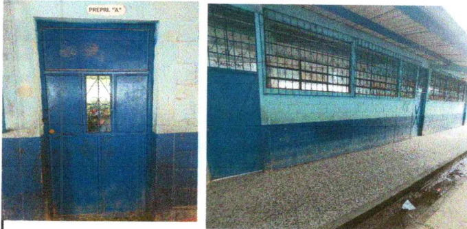
Foto 3: Mantenimiento a puertas de metal, lijado y pintado, de 5 aulas.