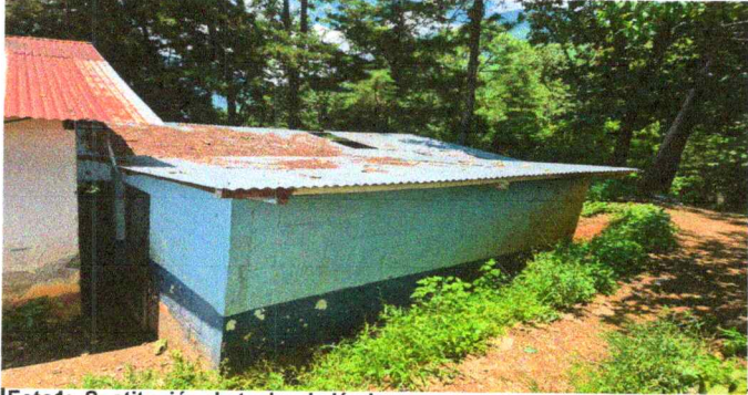
Foto1: Sustitución de techo de lámina