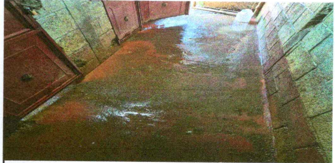
Foto 6: Sustitución de piso de torta de concreto por piso de granito

Observación: Si es necesario se pueden agregar hojas adicionales y actualizar el número de hojas.