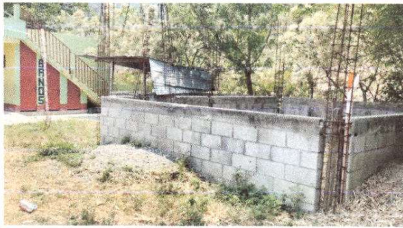
Foto 9: al terminar el muro se coloran estructura de metal y cubierta de lamina