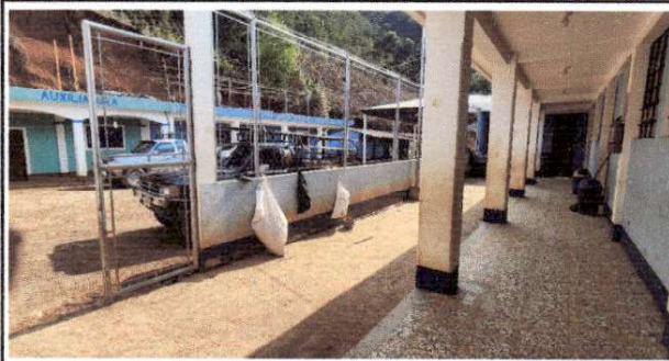
Foto 3: Vista del piso del pasillo , se observa el área donde se colocara techo.