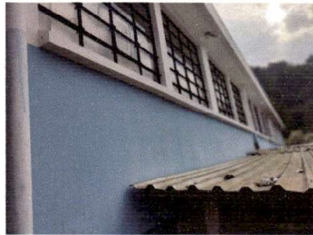
Foto 10: Vista de las ventanas en la parte de atrás del modulo 1.