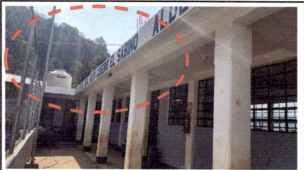
Foto 4: Se observa el área donde se colocara el techo metálico , colocando laminas transparentes.