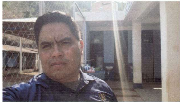
Foto1: Evaluador de campo en el establecimiento.