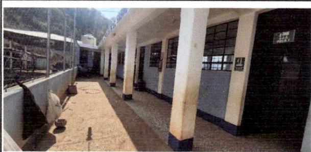
Foto 5: Se observa el área donde se colocara el techo metálico , colocando laminas transparentes.