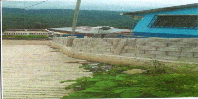
Foto1: MURO PERIMETRAL