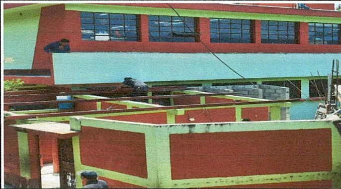
Foto1: Sustitución de lámina por Lámina troquelada calibre 26