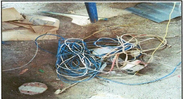
Foto 4: Sustitución de sistema electrico (cableado, focos y plafoneras)