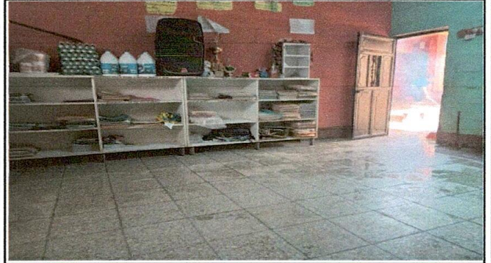
Foto 2: dirección del centro educativo con piso de granito y puerta nueva