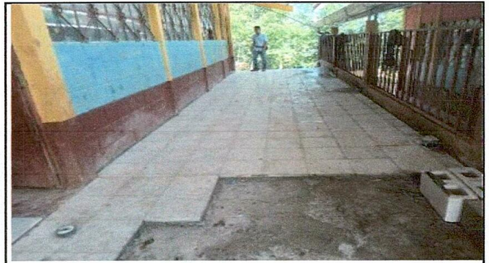
Foto 4: sustitución de piso de concreto por piso de granito en corredor del centro educativo