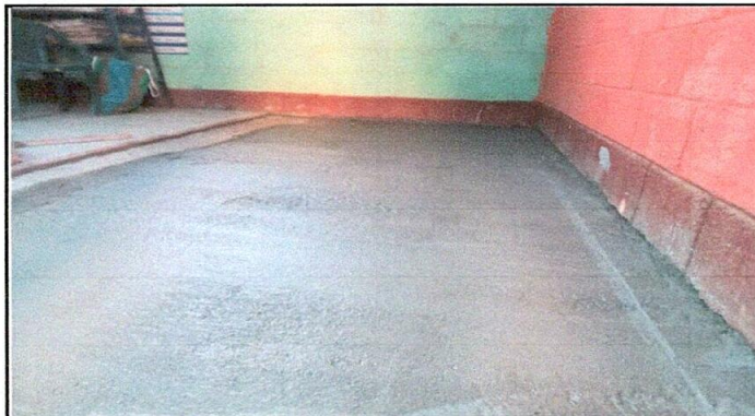
Foto 3: reparación de piso de concreto dirección del centro educativo