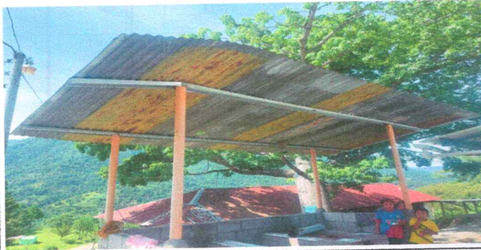
Foto1: MEJORAMIENTO DE MURO COCINA 6 HILADAS DE BLOCK