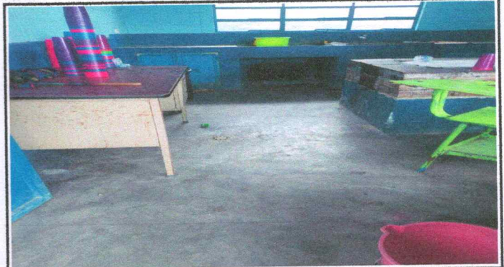
Foto 2: SUSTITUCION DE PISO DE CONCRETO (POR PISO ANTIDESLIZANTE)