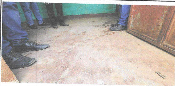
Foto 9: se observa el piso en mal estado, y la puerta esta oxidada.