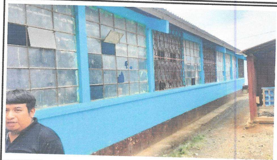
Foto 8: Vista parte de atrás de modulo 1, se observan ventanas, las cuales se cambiarán y también se colocarán balcones.