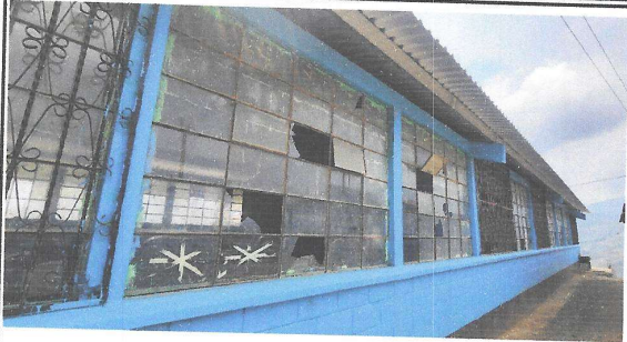
Foto 7: Vista parte de atrás de modulo 1, se observan 9 ventanas, las cuales se cambiarán y también se colocarán 6 balcones.