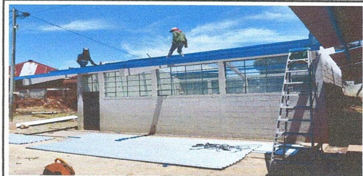
Foto 4: Colocación de nuevas costaneras y de luz eletrico de la EORM, Caserio Las Cruces.

Observación: Si es necesario se pueden agregar hojas adicionales y actualizar el número de hojas.