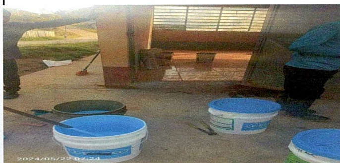
Foto 5 aplicación de pinturas.