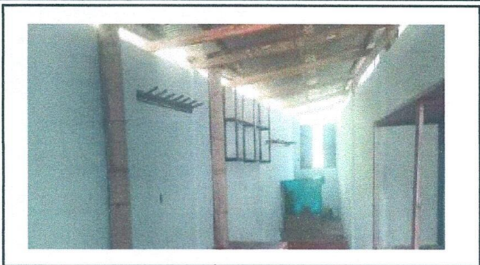
Foto1: Reflejo de la pintada de los paredes de la cocina, terminado.