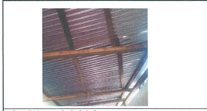
mejoramiento en acabado de techo

Observación: Si es necesario se pueden agregar hojas adicionales y actualizar el número de hojas.