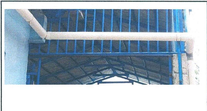
Foto1: reparacion de bajada pluvial PVC 4