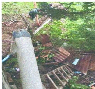
Foto 4: sustitucion de tuberia PVC linea principal de aguas negras