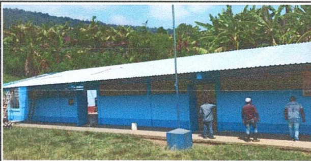
Foto 5: Padres de familia terminando el techo y la pintura de la escuela.