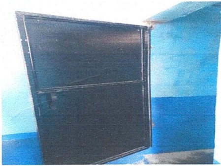
3. En la imagen se observa que se cambio una de las once puertas que necesitaban los baños.