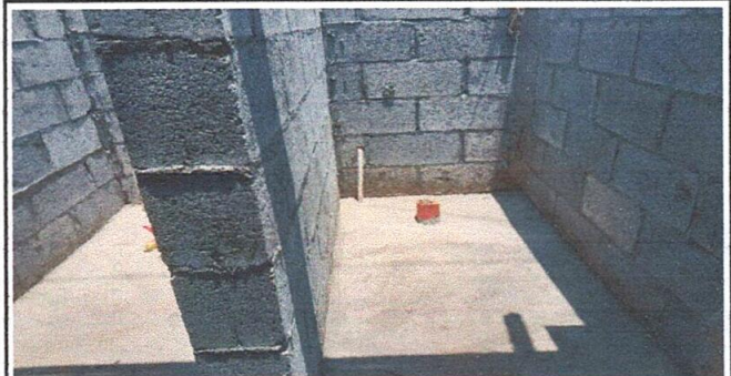
Foto 6: en la fotografía se observa la tubería de drenaje que se daño por lo cual se hizo la sustitución de tubería para drenaje

Observación: Si es necesario se pueden agregar hojas adicionales y actualizar en formato de hojas.