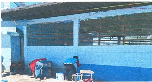
Foto 5: En la fotografía se observa el mantenimiento de paredes exteriores e interiores tanto de el módulo completo y las paredes de los sanitarios que quedan a un costado del módulo.