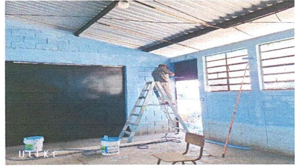
2. Aquí se puede ver que los trabajos de mantenimiento de ventanas y cambio de vidrios rotos y cambio de vidrios transparentes a nevados.