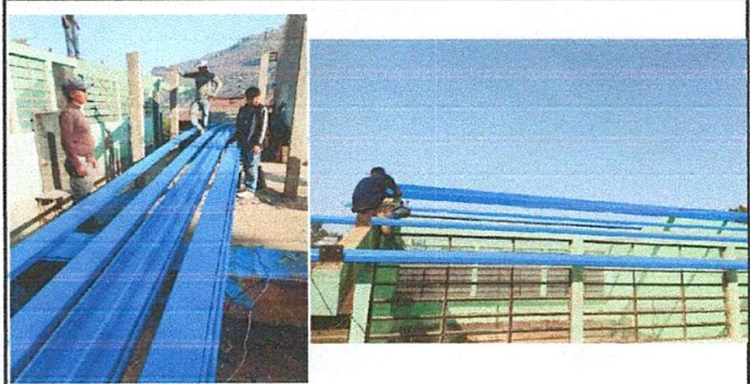
Foto 2: Mantenimiento y colocación de estructura de metal de techo