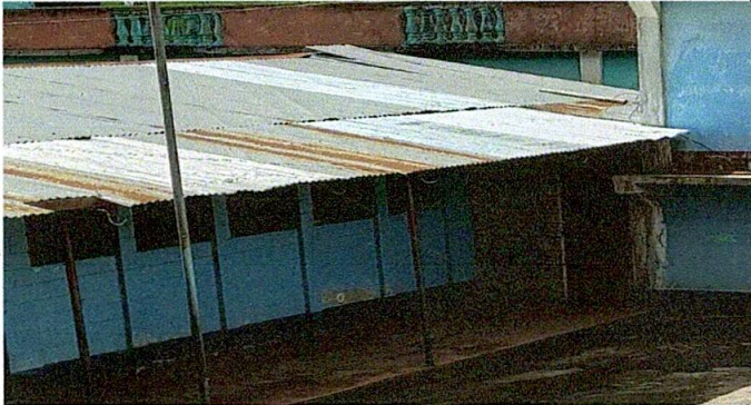
Foto1: Asi estaba los aulas