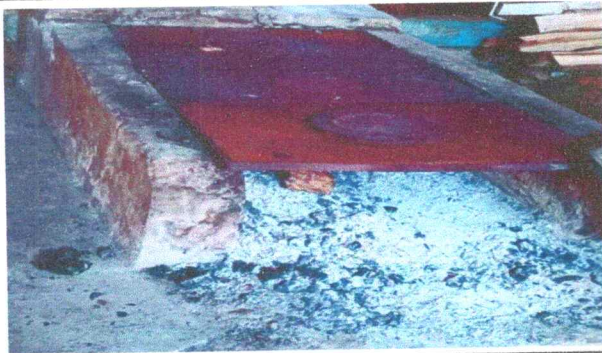
Foto 5: en la fotografías se observa una plancha lo cual no cumple con su función y se pretende la sustitución por 2 fogones de mediana altura.