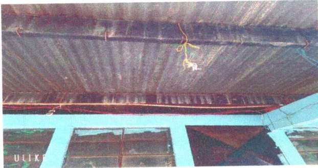
Foto 3: en la fotografía se observa las estructura de soporte de techo de metal ya muy deteriorada, por lo cual se pretende darle mantenimiento a cada uno.