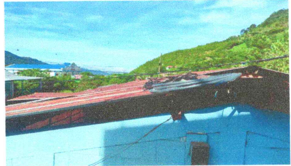
Foto 2: En la imagen se observa el capote deteriorado e inservible