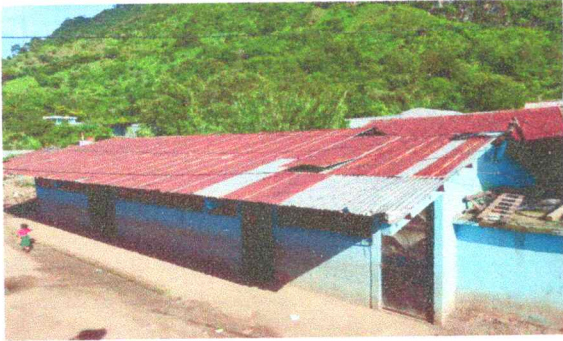
Foto 1: En la fotografía se observa el techo en malas condiciones y muy viejas