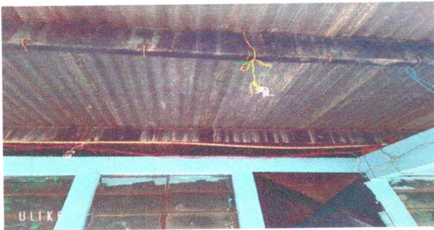
Foto 3: en la fotografía se observa las estructura de soporte de techo de metal ya muy deteriorada, por lo cual se pretende darle mantenimiento a cada uno.