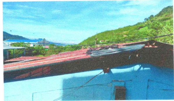
Foto 2: En la imagen se observa el capote deteriorado e inservible