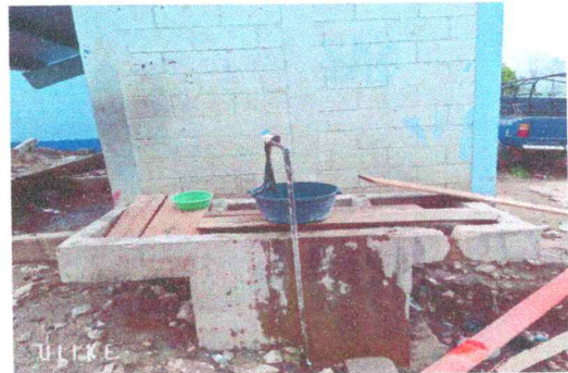
Foto 6: En la imagen se observa una pila en mal estado con sus lavaderos descascarados y su estructura con grietas .

Observación: Si es necesario se pueden agregar hojas adicionales y actualizar el número de hojas.