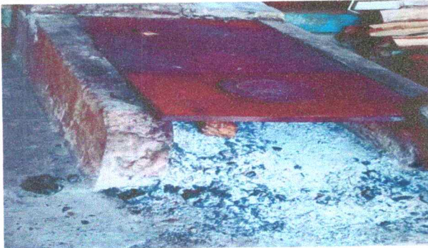
Foto 5: en la fotografías se observa una plancha lo cual no cumple con su función y se pretende la sustitución por 2 fogones de mediana altura.