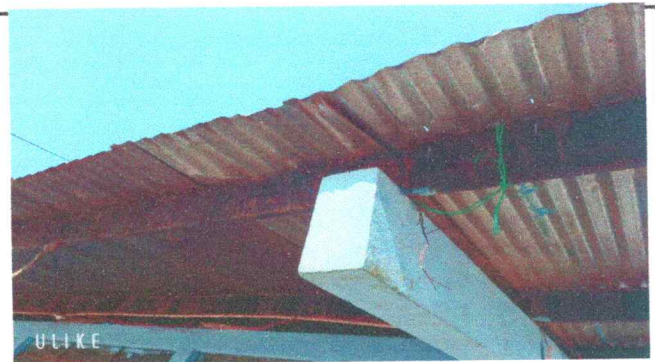
Foto: 4 En la imagen se observa que la estructura de soporte de metal se encuentra muy oxidado