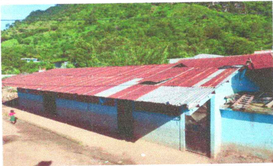
Foto1: En la fotografía se observa el techo en malas condiciones y muy viejas