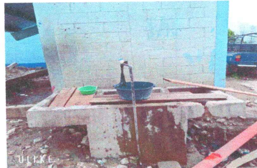
Foto 6: En la imagen se observa una pila en mal estado con sus lavaderos descascarados y su estructura con grietas .

Observación: Si es necesario se pueden agregar hojas adicionales y actualizar el número de hojas.