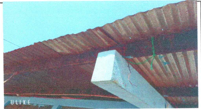
Foto: 4 En la imagen se observa que la estructura de soporte de metal se encuentra muy oxidado