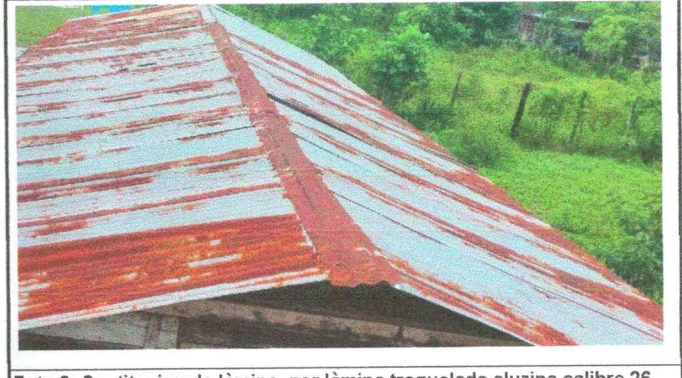
Foto 2: Sustitucion de lámina, por lámina troquelada aluzinc calibre 26