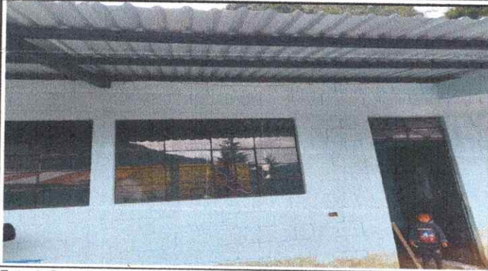
Foto 1: Sustrucción de lamina por laminas troqueladas aluzinc, por deterioro y picado.