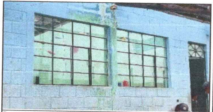
Foto 6: Sustrucción de estructura de metal de ventana, sustitución de vidrios por quebrados y marcos oxidados.

Observación: Si es necesario se pueden agregar hojas adicionales y actualizar el número de hojas.