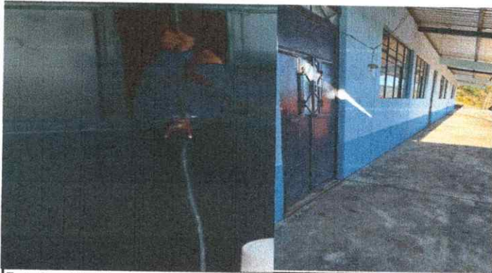
Foto 3: sutitución de puerta, puertas ya muy deterioradas y oxidadas.