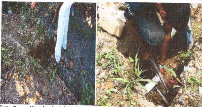
Foto 5: sustitución de tubos de red de agua potable por tubos ya quebrados.