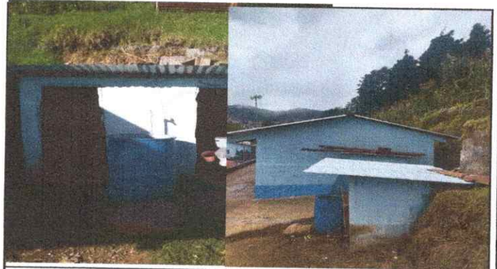
Foto 4: Sustrucción de puertas de servicios sanitarios, cambio de madera a metal.