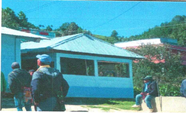
Foto1: Cambio de cubierta de lamina en cocina