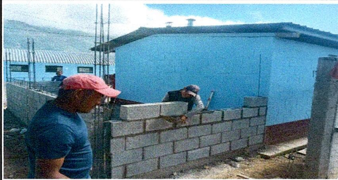
Foto1: Ejecución del renglón de ampliación.