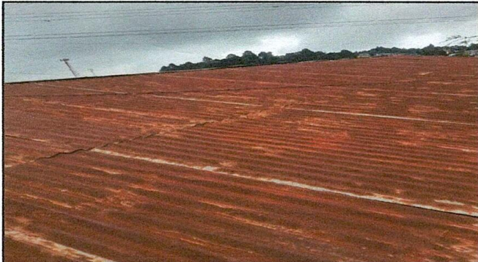
Foto 1: lámina y estructura de soporte de madera en malas condiciones