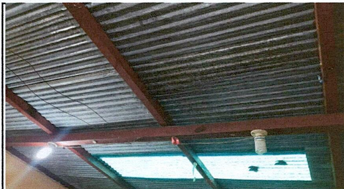
Foto 3. sustitución de cableado eléctrico.