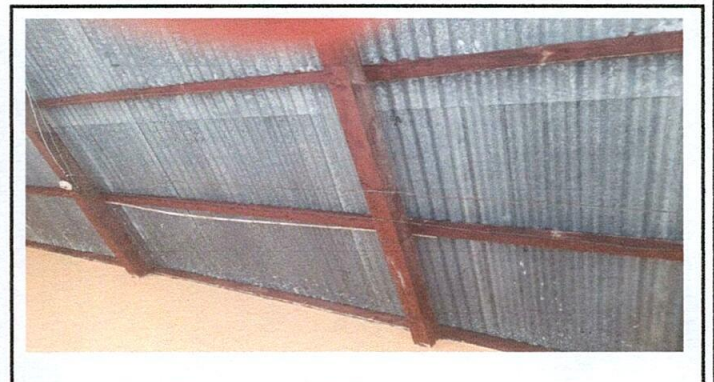
Foto 4. Sustitución de cableado eléctrico