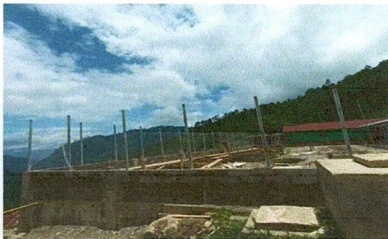
Foto 5: COLOCACIÓN DE TUBOS GALVANIZADOS Y MAYA PARA MURO PERIMETRAL