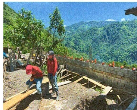
Foto 4: COLOCACACIÓN DE 2 FILAS DE BLOCK MURO PERIMETRAL Y BASE PARA TUBOS GALBANIZADOS