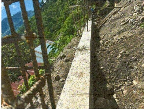
Foto 1: FUNDICIÓN DE 2 METROS DE PROFUNDIDAD Y YA SOBRE LA TIERRA