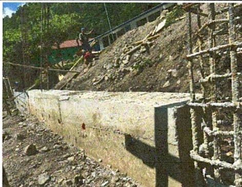
Foto 3: FUNDICIÓN DE 2 METROS DE PROFUNDIDAD Y YA SOBRE LA TIERRA Y COLOCACIÓN DE LOS PRIMEROS BLOCK PARA MURO