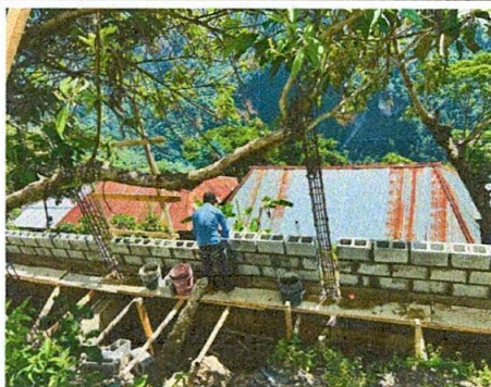
Foto 5: COLOCACIÓN DE BLOCK PARA MURO DE CONTENCIÓN A UN 50% DE AVANCE