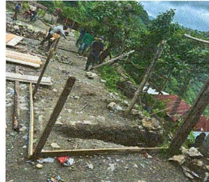
Foto 2: AVANCE DE MANO DE OBRA NO CALIFICADA DE PADRES DE FAMILIA