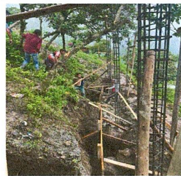
Foto 6: Arranque y colocación de columnas con hierros de 5/8 y 1/2

Observación: Si es necesario se pueden agregar hojas adicionales y actualizar el número de hojas.