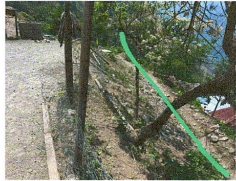
Foto 2: reparación de muro perimetral de block con malla galvanizada, soleras intermedias y columnas