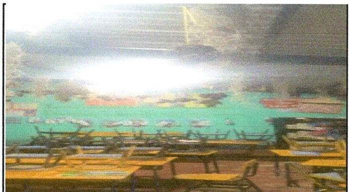
FOTO: 4 INSTALACION DE 3 FOCOS