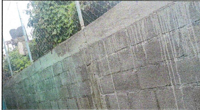
FOTO: 1 SUSTITUCION DE MURO PERIMETRAL DE BLOCK CON TUBO HG Y MALLA GALVANIZADA