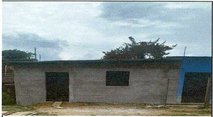
FOTO: 2 MEJORAMIENTO PARED DE COCINA