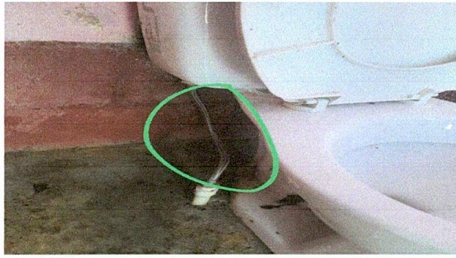
Foto 1: Sustitución de accesorios inodoro (contra llave, tubo de abasto y tanque)