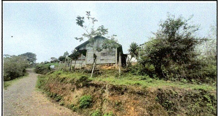
Foto 4: Reparación de muro perimetral de block con tubo hg y malla galvanizada, soleras intermedias y columnas.