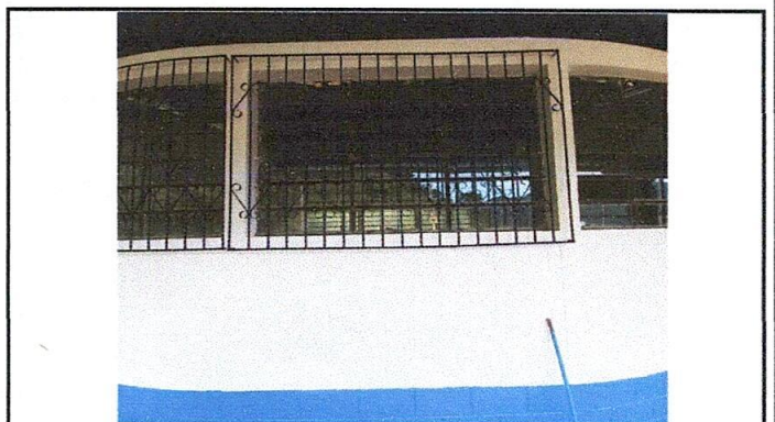
Foto 4: Reparación e instalación de balcones y ventanas finalizado satisfactoriamente.