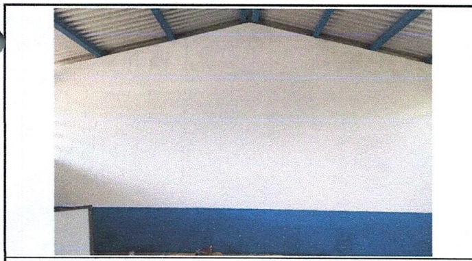
Foto 5: Pintado de paredes interiores y exteriores finalizado con éxito.