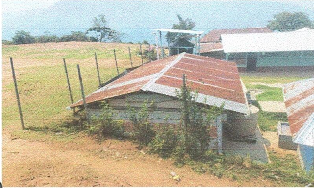
Foto 1: Sustitución de lámina por lámina troquelada para sanitarios