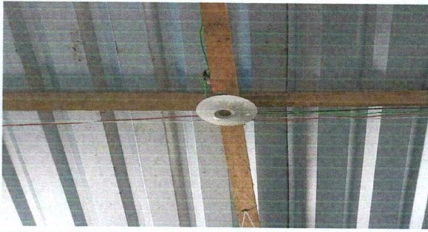
Foto1: REPARACION DEL SISTEMA ELECTRICO