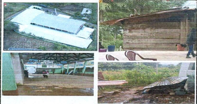
Foto 4: REPARAR TECHO DE LAMINA ALREDEDOR DEL TECHO PARA EVITA LA BRISA DE LA LLUVIA FOTO 5: BODEGA ANTES, PISO DE BODEGA

Observación: Si es necesario se pueden agregar hojas adicionales y actualizar el número de hojas.