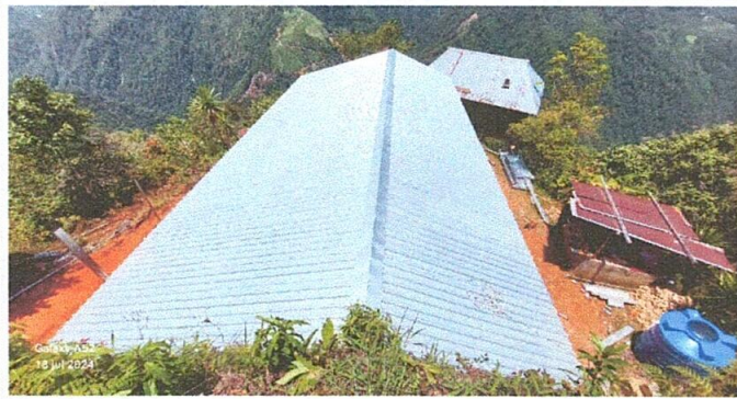
Foto 1: estructura de techo con costaneras y techo de lámina troquelada instalado con satisfacción.