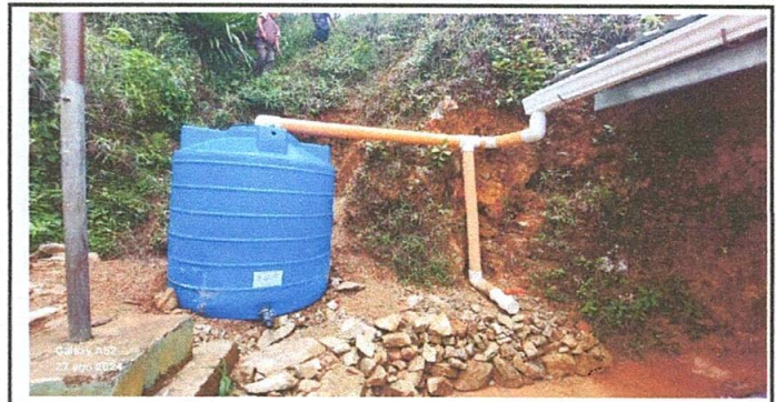
Foto 6: colocación de rotoplas para recolección de agua plubial con satisfacción.

Observación: Si es necesario se pueden agregar hojas adicionales y actualizar el número de hojas.