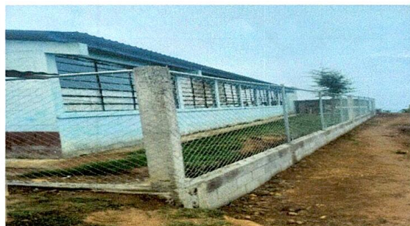
Foto 4: REALIZACIÓN DEL MURO PERIMETRAL ATRÁS DEL CENTRO EDUCATIVO.