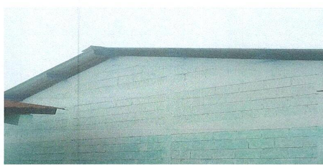
Foto 2: FINALIAZACIÓN DE LA INSTALACIÓN DE CAPOTES DE LAMINA POR LAMINA TROQUELADA.