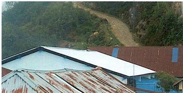
Foto 1: FINALIAZACIÓN DE LA INSTALACIÓN DEL TECHO DE LAMINA POR LAMINA TROQUELADA.