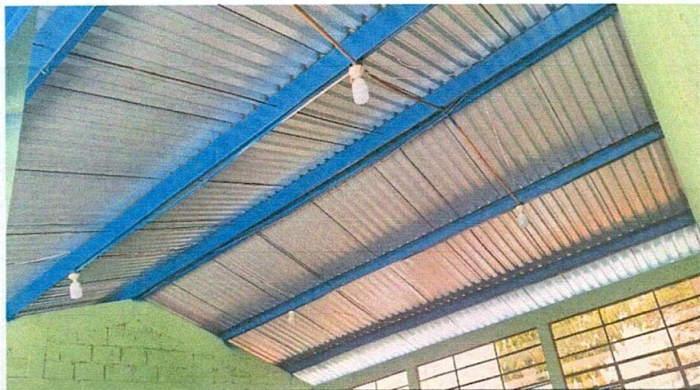
Foto 3 CABLES NUEVOS