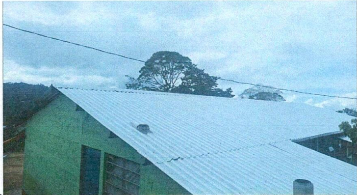
Foto1: LÁMINAS TROQUELADAS NUEVAS