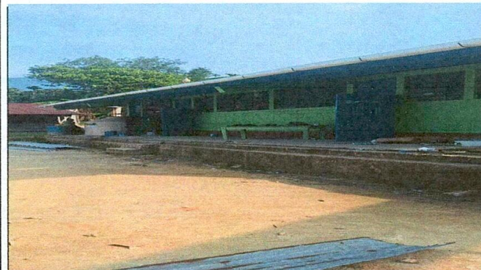
Foto 3 INSTALACIÓN DE CABLES