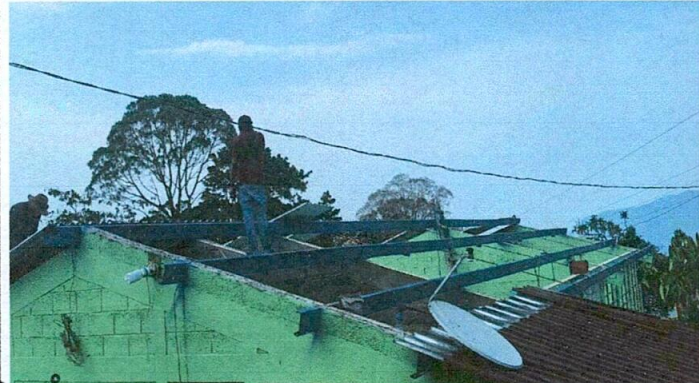
Foto1: INSTALACIÓN DE LÁMINAS TROQUELADAS