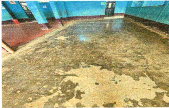
Foto1: SUSTITUCION DE PISO