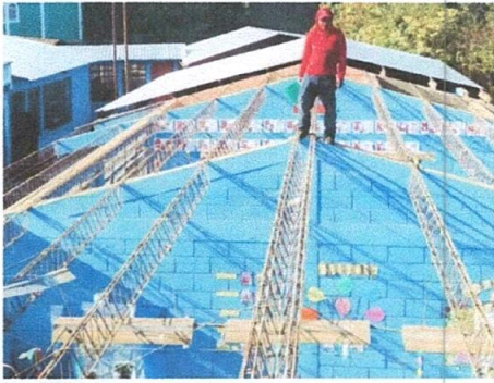
Foto1: Sustitución de Lámina por lámina troquelada