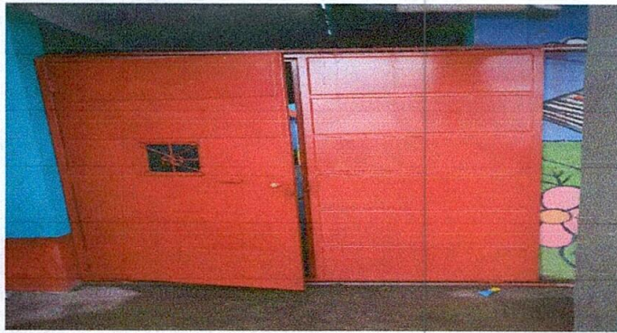
Foto1: Sustitución de portón principal