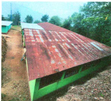
Foto1: Sustitución de láminas