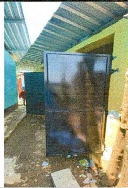
Foto No. 05. Puertas colocadas y trabajo terminado en servicios sanitarios.