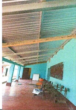
Foto No. 01. Trabajo terminado en cuanto al cambio de Láminas de techo Por Laminas Troqueladas Aluzinc calibre 26, y Costaneras Legitimas Galvanizadas 16 de 4 x 2.