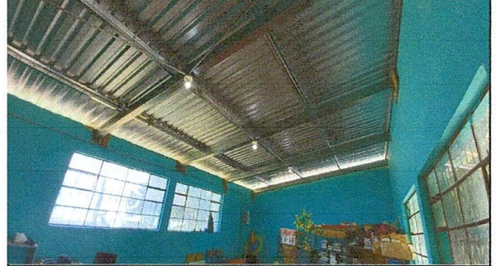
Foto No. 02. Trabajo terminado en aulas, cambio de láminas de techo por laminas Troqueladas Aluzinc calibre 26, y Costaneras Legitimas Galvanizadas 16 de 4 x 2.