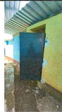
Foto No. 06. Puertas colocadas y trabajo terminado en servicios sanitarios.

Observación: Si es necesario se pueden agregar hojas adicionales y actualizar el número de hojas.