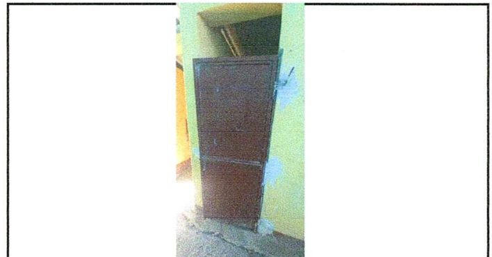
Foto No. 07, Sustitución de puertas de metal de baños para niños.

Observación: Si es necesario se pueden agregar hojas adicionales y actualizar el número de hojas.