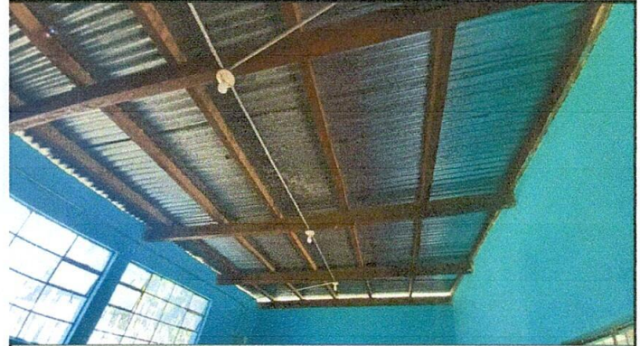
Foto No. 02, Mejoramiento del techo a través del cambio de soporte de madera a soporte de metal.