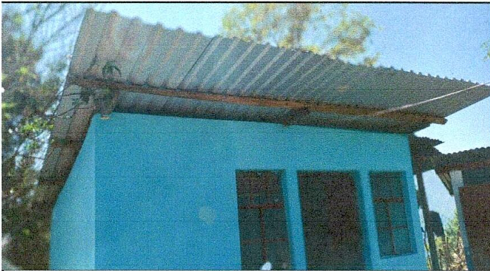
Foto No. 03, Mejoramiento del techo de cocina a través del cambio de soporte de madera a soporte de metal.