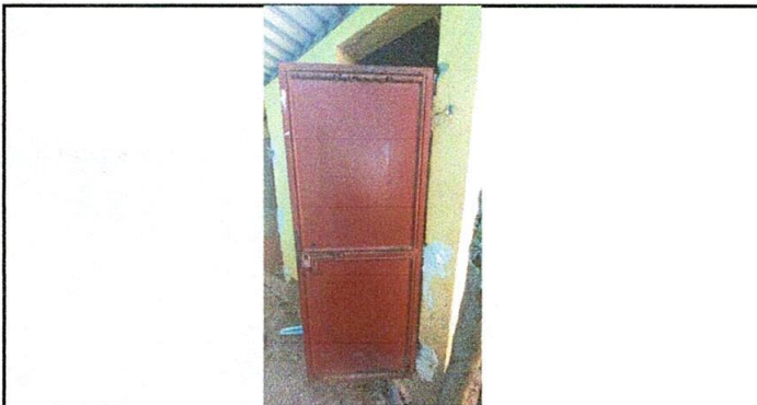
Foto No. 06, Sustitución de puertas de metal de baños para niñas.