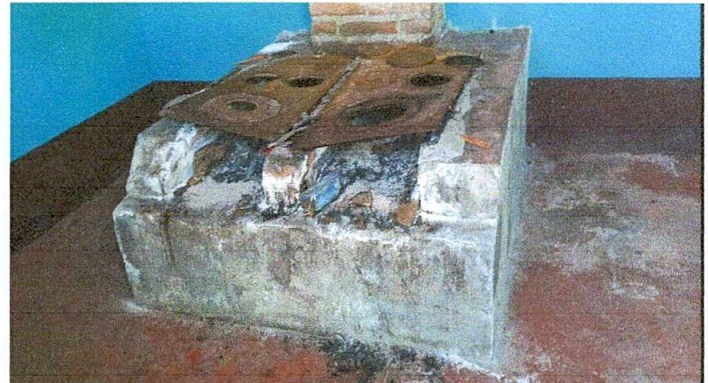
Foto No. 04, Sustitución de estufa rural (completa) incluye chimenea y plancha de metal