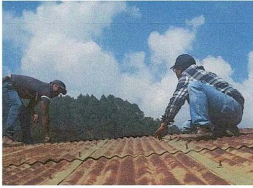
Foto1: Inicio del desentechado de la escuela (Cubierta de lámina: Renglón 1)