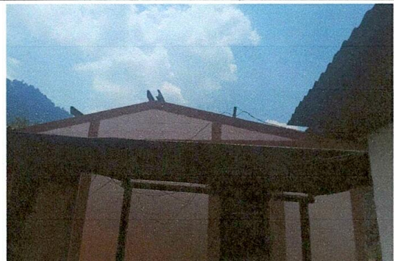
Foto 4: Así quedó la escuela cuando las láminas se lo han quitado