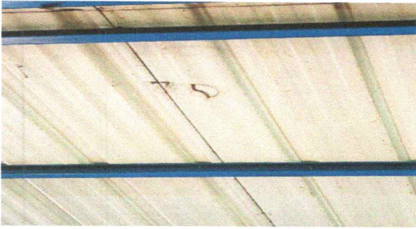
Foto1: Sustitución de lámina, por lámina troquelada